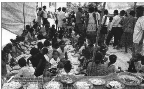
Ώρα για φαγητό