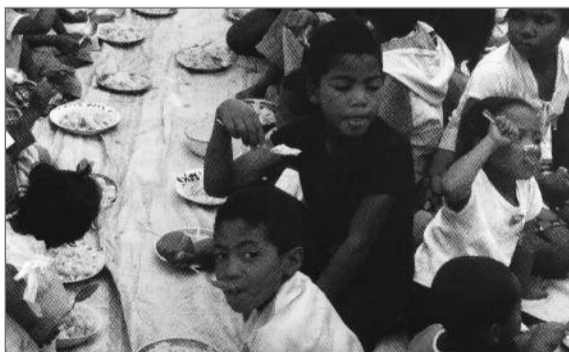
Παιδιά τρώνε το φαγητό τους