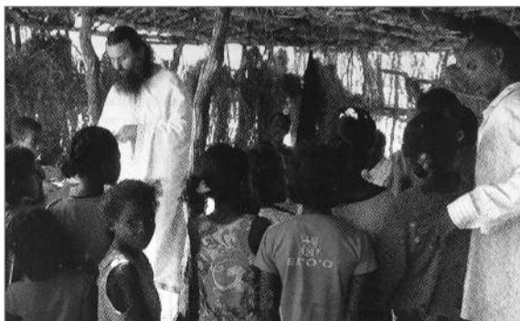
Θεία Λειτουργία σε αχυροκάλυβη εκκλησία

«Εξωτερική Ιεραποστολή», Ιούνιος 2016, σελ. 28-31